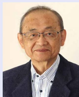
会長 浅野 史郎 元宮城県知事

宮城県知事の時、障がい者が地域の中で尊厳をもって生きられることを願って地域生活への移行を進めました。本協会は、災害時でも誰もが地域で共生できる社会を目指して活動します。